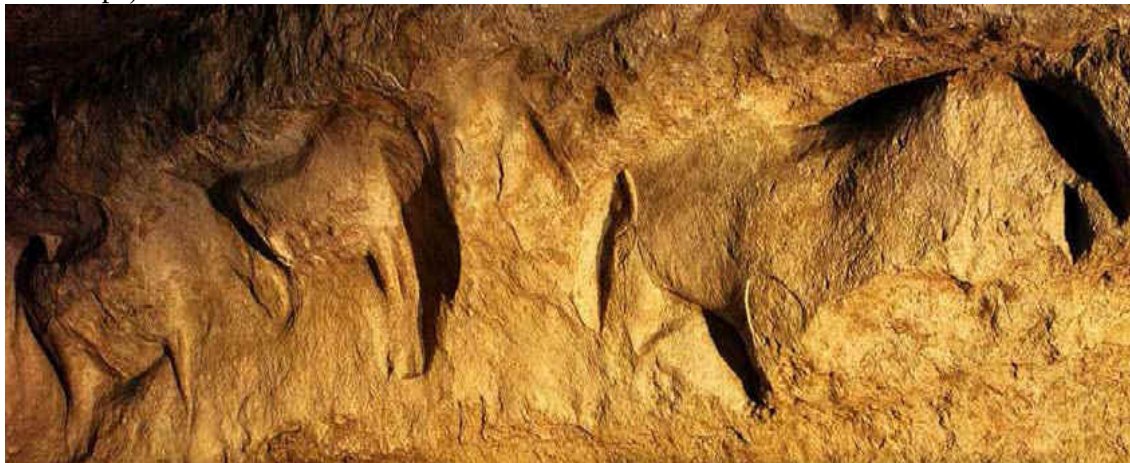
Friso de los caballos de Cap-Blanc

Se atribuyen asimismo a este periodo ciertos bajorrelieves que representan animales alineados , entre los que destaca el friso de caballos de Cap-Blanc y algunos bloques de piedra con relieves de Roc de Sers, en los que aparecen caballos, bisontes, ciervos, toros e incluso pájaros.