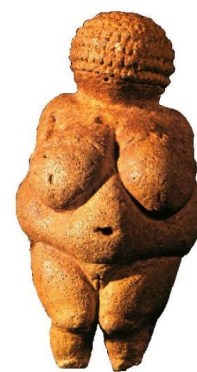
Venus de Willendorf

Están realizadas en materiales muy distintos: marfil ( Venus de Lespugue ), piedra caliza ( Venus de Willendorf ), serpentina ( Venus de Savignano ). De este mismo periodo se han descubierto también algunas estatuillas que representan animales, especialmente mamuts, osos e íbices de arcilla, y caballos, mamut y felinos de marfil, e incluso han aparecido figuras hechas con una pasta de polvo de marfil de mamut, piedra blanda, arcilla y cenizas de hueso pulverizado.